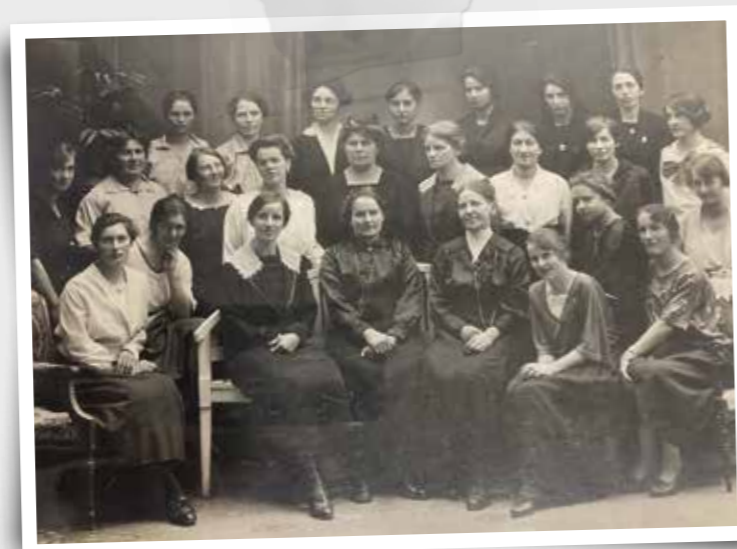
Membres des Unions Chrétiennes de Jeunes Filles d'Yverdon, prise le 22 septembre 1922 à l'Etoile.

Du 16 au 20 juin prochain, nous allons fêter ce centième anniversaire de l'Etoile en y associant les locataires qui l'ont désiré. La salle Rochat, meublée à l'ancienne, présentera le matériel d'archive durant toutes les festivités.