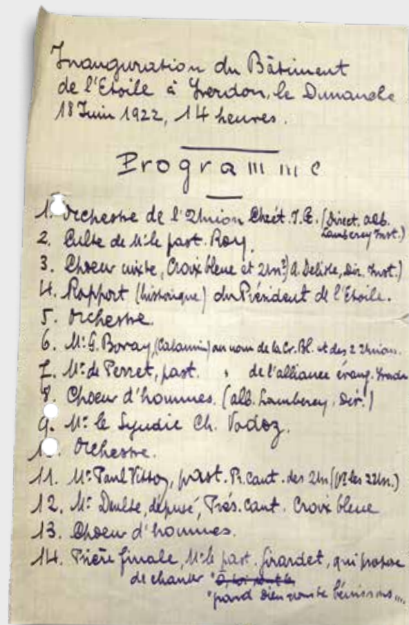
Le programme d'inauguration du Bâtiment de l'Etoile, le 18 juin 1922.